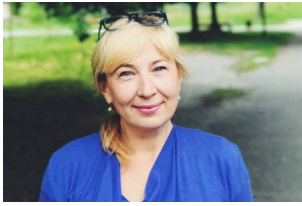
Фото надане Амбасадоркою

Детальніше про Амбасадорку - на сайті проекту mustpost.today